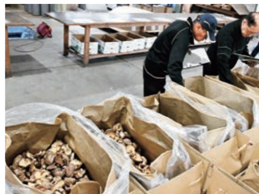
シイタケの出来栄を確かめる参加者

JA管内でシイタケの出荷が最盛期を迎え、JAしいたけ部会は4月9日、JA上陽野菜集荷場で、乾燥シイタケの入札会を開きました。