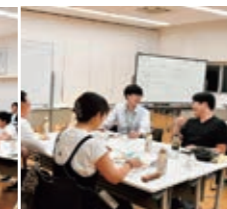
【第3講】 「地域の未来とJAを考えよう」