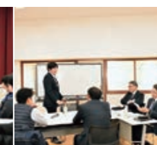
【第7講】 JA役員とのディスカッション/閉講式