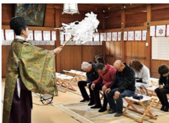
家畜への感謝の気持ちをささげた「畜魂祭」

JA畜産研究会は3月16日、黒木町の津江神社で畜魂祭を開き、研究会員やJA担当職員8人が出席しました。