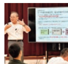
【第4講】 「信頼され結果を出す人の法則」