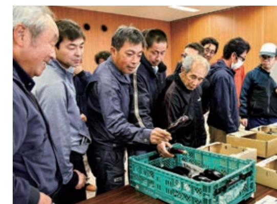
冬春ナスの出荷規格を入念に確認する参加者

JAなす部会は3月25日、筑後・立花・黒木の各地区で冬春ナスの目合わせ会を開きました。出荷最盛期を前に、規格を統一して高品質なナスの出荷を徹底し、有利販売につなげるのが目的です。