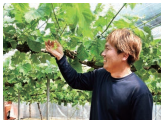
生育状況を確認する部会員

JAぶどう部会は3月23日、シャインマスカット栽培管理講習会を開き、部会員らやJA担当職員など約20人が参加しました。