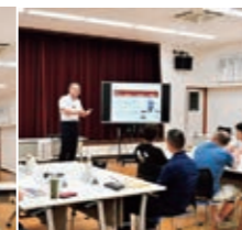
【第2講】 「JA・協同組合の理解を深める」