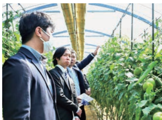
ほ場で生育状況を視察する市場関係者ら

JAとまと部会は3月24日、八女市で中間検討会を開きました。市場担当者ら17人が参加し、ほ場視察や意見交換を通じて生育状況や品質、今後の出荷見通しを確認しました。