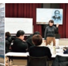
【第6講】 「協同組合から考えるJAの期待と役割」