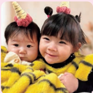
上陽町の一誠・成美さんの二女・長女

妹に「おうちゃんがいるから大丈夫だよ!」と声をかける優しい姿に幸せを感じています♥