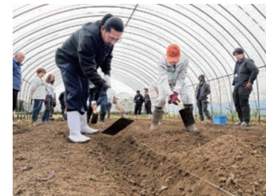
畝立てをする塾生とJA職員

JAは、4月4日、第15期となる「今こそ農業塾」をJA就農支援センターで開講し、12人が入塾しました。