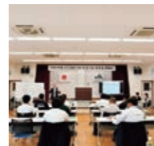
【第1講】 開講式/基調講演