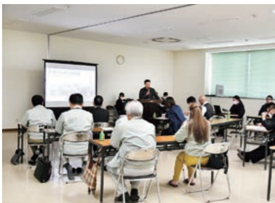
検討結果を発表するJA職員

JA立花地区センターは3月12日、将来の立花地区の地域農業の発展につなげようと「検討結果発表会」を開きました。新規作物として適切な農産物について検討することで地域農業の発展について考える場を設けようと今年初めて開催されました。発表会では、職員らが調査対象として選んだコーヒー豆とライチについて、約1年間にわたり検討した結果を発表しました。