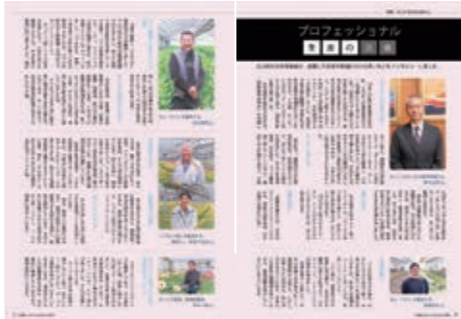
広報誌「広報ヒロカワ」