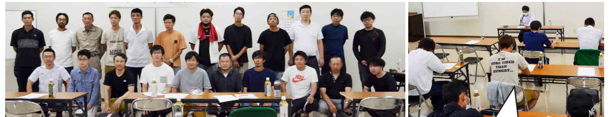
セミナーに参加した青年部員やJA職員

J A 立花地区青年部では、農家にとって必要な知識・技術の向上を図るため、毎年スキルアップセミナーを開いています。セミナーのテーマは毎年部員たちから募り、栽培技術から農業経営に関わることまで幅広く学んでいます。今年「税金」をテーマに、立花地区の青色申告を担当する税理士を講師に招き、講義を行いました。