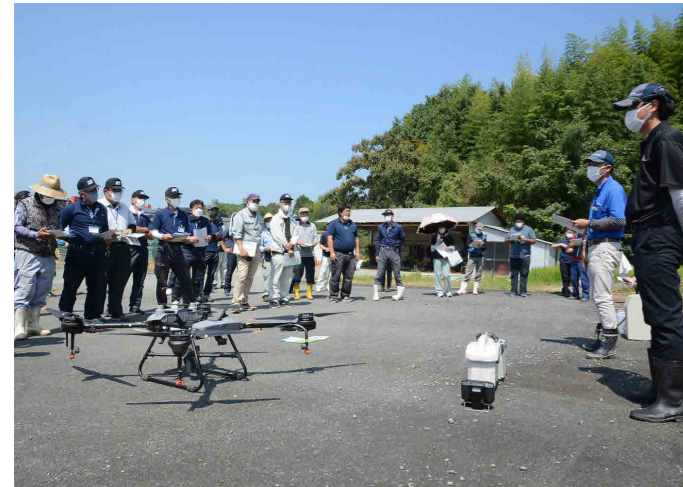
ドローン使用時の注意点について説明するメーカー社員

その後行われた空散用ドローンの実演会では、㈱丸山製作所の社員2人が操縦役のオペレーターと指示役のナビゲーターとなり、水稻のほ場一面に農薬を散布。無人ヘリコプターと比べて、本体が軽量で操縦が容易な上、低価格で個人購入も比較的容易であることを説明しました。また、通常の防除より高濃度で農薬を空中散布するため、手袋をした状態で作業を行うことや近隣への飛散防止など安全への配慮を怠らないことなどを呼び掛けました。ドローンを使用する場合、令和4年6月から100g以上の機体は国土交通省への登録が必要となっています。