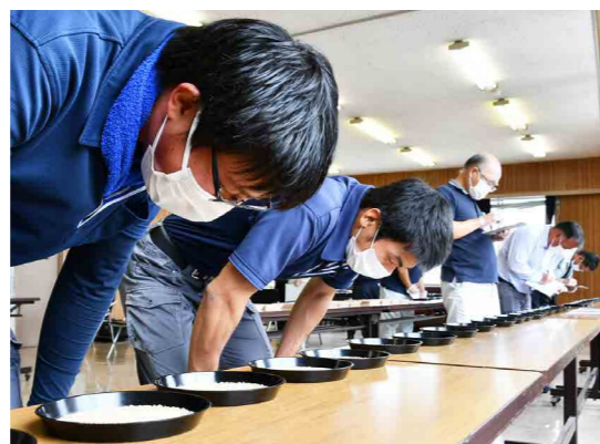
玄米や大豆を鑑定する農産物検査員ら

米・大豆の収穫時期を控え、農産物検査員の鑑定技能の確認を行う「米および大豆検査技能確認会」が、9月2日にJA全農ふくれん八女総合物流センターで行われました。JAふくおか八女からは、検査資格を持つ約20人が参加し、米や大豆の等級、品種を見極めました。