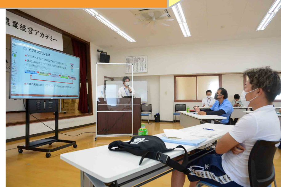
経営拡大を目指して講義を受ける生産者ら