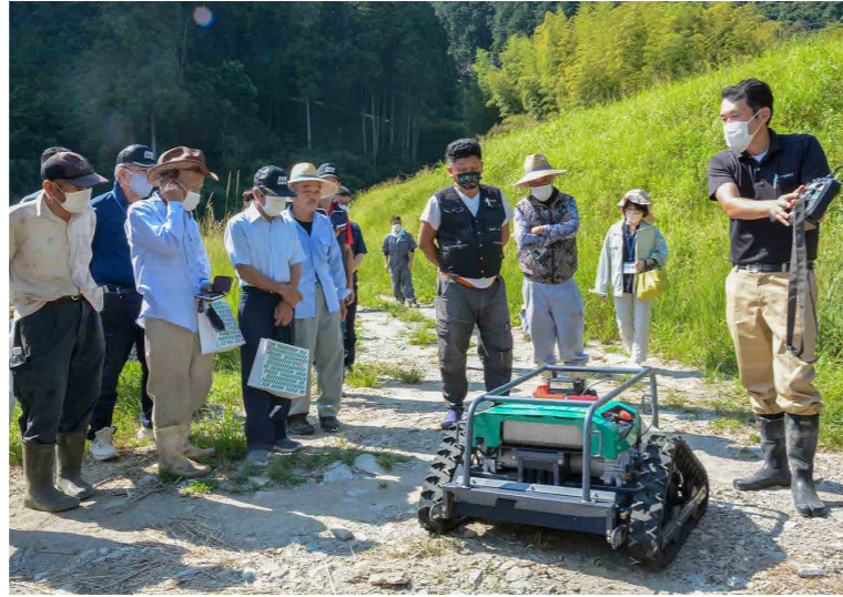
ラジコン草刈機の性能について説明するメーカー社員

実演会では㈱オーレックの社員がラジコン草刈機やスパイダーモアと呼ばれる取っ手が回転する草刈機の性能について解説。操縦者が斜面に立つことなく作業が可能となることから、足場の悪い環境でも安全に作業できることをPRしました。