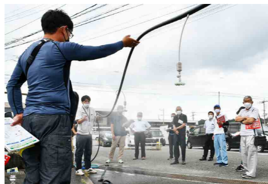
吊り下げ式の散水資材について実演を通して学ぶ参加者

JAすもも部会は8月26日、黒木町のJA黒木地区センターで、ハウス栽培のスモモの高温障害対策についての勉強会を開きました。近年、開花期と収穫期における高温障害が発生している園地が増える中、対策として栽培管理を徹底することや、高温を防ぐための被覆・散水資材の効果について学ぼうと、初めて開催しました。