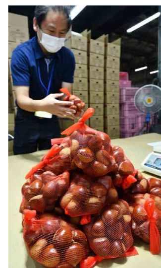
出荷が始まった栗

黒木町のJA黒木集荷場では、シーズン通して「丹沢」「銀寄」「ぼろたん」などの品種を集荷しています。令和4年産は、生育は