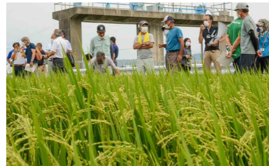
乾田直播による生育の様子を確認する参加者

水稲栽培の省力化に向けて、農研機構九州沖縄農業研究センターでは「振動ローラ式乾田直播」の普及拡大に取り組んでいます。乾田直播とは育苗箱を使わず田んぼに直接種もみをまき、葉が伸びてから水を入れる方法です。8月23日には生産者やJA、行政機関を対象とした見学会を開催。参加者からは防除回数や生育スピード、作業のしやすさについて質問があがりました。