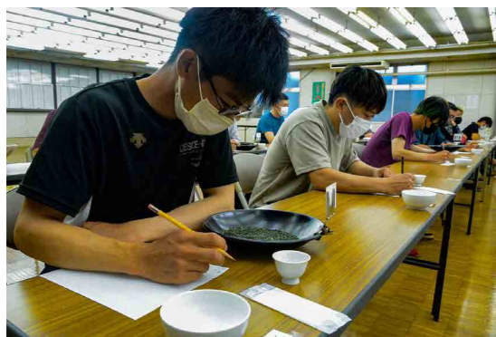
荒茶の特徴を記録する競技者

福岡県茶業青年の会は8月30日、JA全農ふくれん茶取引センターで、闘茶会を開きました。茶に対する知識や理解を深め、生産技術の向上を図ることが目的です。闘茶会では、茶葉の色・香りで判断する外観と抽出されたお湯の色・香り・味で判断する内質の2部門の総合得点で優勝を競いました。