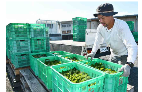
生産者によって持ち込まれるイチゴ苗

JAいちご部会で、株冷(低温暗黒処理)作業が行われました。同部会では、安定した出荷量の確保や収量アップに向け毎年取り組んでいます。株冷、夜冷処理した苗と普通苗を定植することで花芽の分化を促進し、収穫時期を調整。クリスマスや年末年始などの需要期に合わせた出荷による有利販売を目指します。