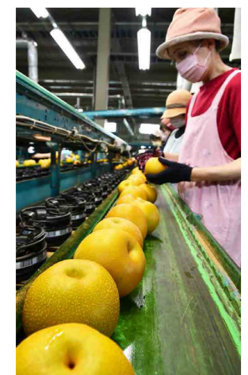
選果される梨「豊水」

JAなし部会で、8月12日から始まった梨「豊水」の出荷が最盛期を迎えました。令和4年産は開花期の霜害により結実不良などの影響が出たものの、それ以降は順調に生育し、糖度も高く高品質に仕上がりました。