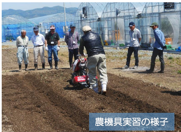
農機具実習の様子