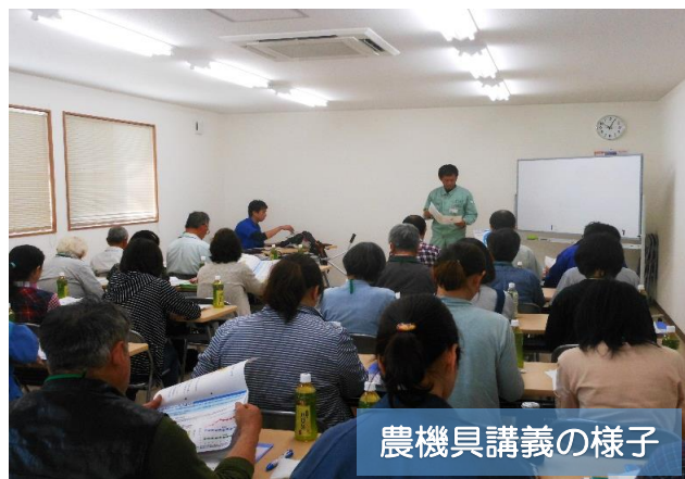
農機具講義の様子