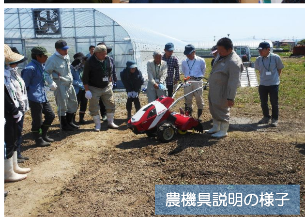
農機具説明の様子