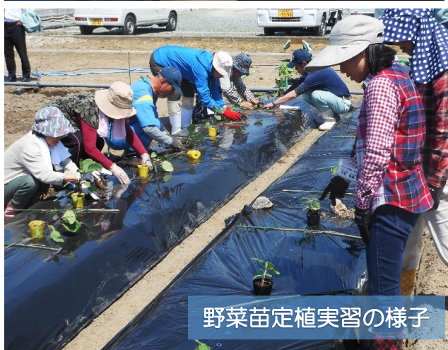
野菜苗定植実習の様子