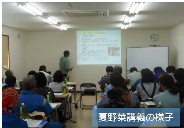
夏野菜講義の様子