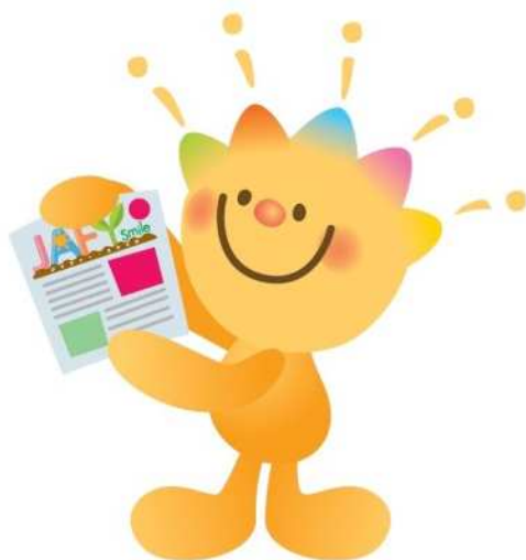
JAふくおか八女 マスコットキャラクター ジャフィーくん

また、地域コミュニティ誌「JAFY Smile（ジャフィースマイル）」を年3回発行しており、当JAのマスコットキャラクターである「ジャフィーくん」が旬な情報を提供しております（39,500部発行/回）。